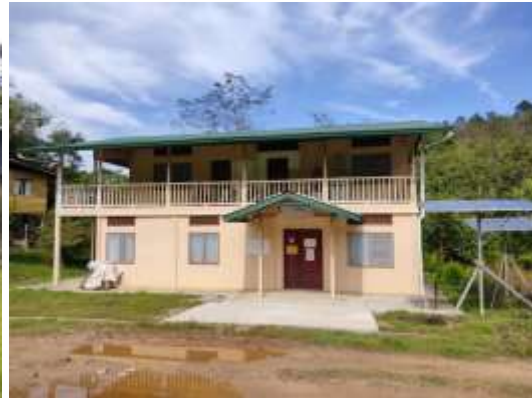
Gambar 2: Klinik Kesihatan