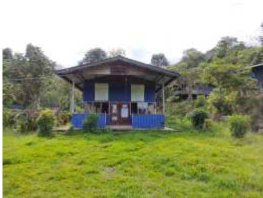
Gambar 1: Dewan Komuniti.

turut menjalankan aktiviti menternak ayam kampung dan ternakan yang lain. Kawasan kajian masih dikelilingi hutan, mempunyai sungai yang masih belum tercemar dan bersempadan Taman Banjaran Croker. Oleh yang demikian, tidak hairan sebahagian daripada penduduk di kawasan kajian masih lagi bergantung kepada sumber sungai dan hutan untuk kelangsungan hidup mereka. Kawasan kajian turut dilengkapi dengan kemudahan seperti klinik, tadika, sekolah rendah dan dewan komuniti.